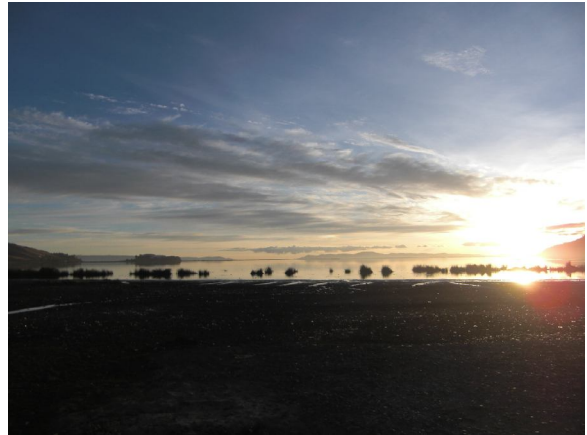
Sonnenaufgang am Titicacasee