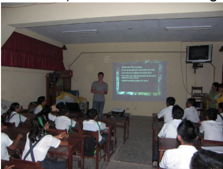
Bei den Vortraegen an einer Schule